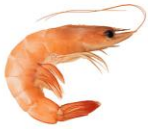
HOSO Head On, Shell On