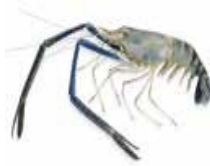
FRESH WATER SHRIMP